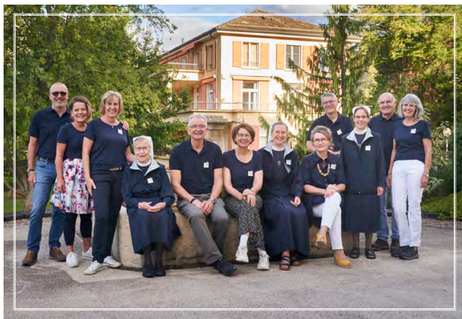
Membres de la Communauté élargie, septembre 2022

Nous tenons ici à remercier tous nos collègues pour la qualité de leur engagement et de leurs compétences mises au service de la vision de Saint-Loup. C'est un privilège de travailler dans un climat où chacun est zélé en tirant à la même corde.