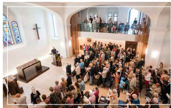
Fête à l'occasion des 180 ans de l'Institution des diaconesses, le 10 septembre 2022

Tous les développements et projets que vous découvrez dans les pages de ce journal ne sont