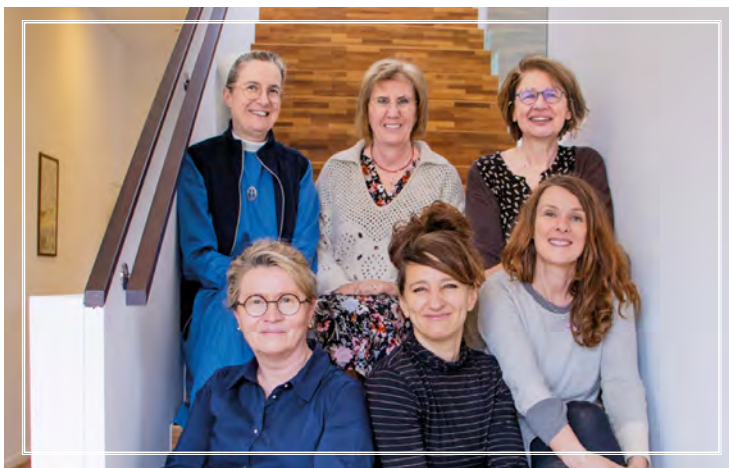
Collaboratrices du ministère d'Accueil

Le temps de partage de la parole à 11 heures est très apprécié et apporte souvent un éclairage nouveau sur des textes déjà connus. C'est le temps que je préfère car chacun y participe et on peut ainsi s'enrichir mutuellement.