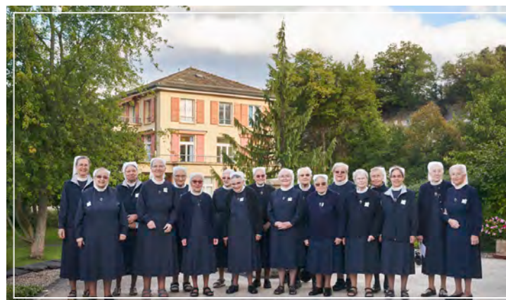
Les diaconesses de Saint-Loup en septembre 2022 (3 absentes)